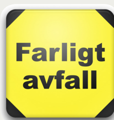
Applikationen Farligt avfall – som den ser ut i Android och Iphone smartphones.

Med stöd från SBUF togs 2003-2004 fram en handbok ”Farligt avfall – bygg och anläggning”. Handboken har fått stort genomslag, är fortfarande efterfrågad och har nu spridits i 9 000 exemplar!