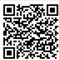
QR-kod för nedladdning från Google Play.

Appen Farligt avfall är indelad i fyra sektioner: