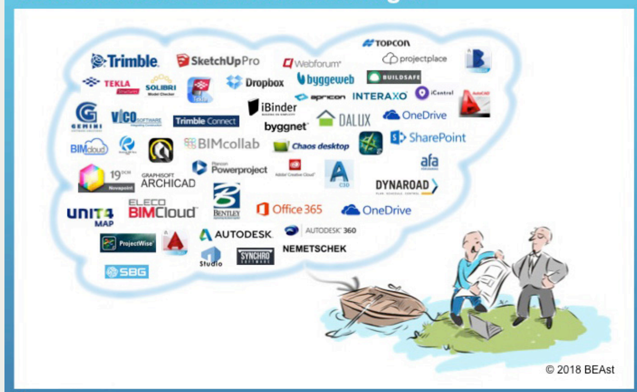
Figur 1. Alla har haft sitt eget sätt att överföra bygghandlingar digitalt och behovet av en standard har varit påtagligt.

I dagsläget får endast ett fåtal av alla byggprojekt digitala leveranser av bygghandlingar och om det sker digitalt är det ändå med en hel del manuell hantering. Att förenkla och automatisera processen genom att överföra både handlingar och uppgifter om handlingarna har nu möjliggjorts med den standard som projektet tagit fram, något som visat sig leda till förenklade rutiner, lägre kostnader och färre fel.