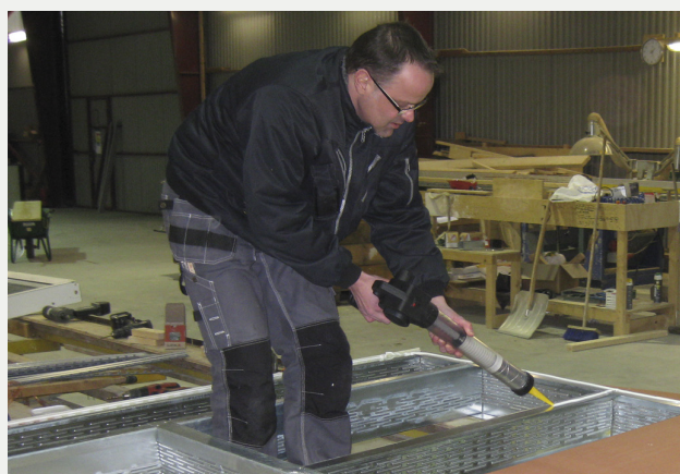
Figur 2. Limning ger tätt skivmontage utan ansträngning.