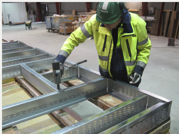
Figur 1. Blindnitning av förborrad stomme möjliggör arbete längre bort från kroppen.

För fönster och dörrinfästningar finns ännu inga riktigt bra och kvalitetssäkrade lösningar. Karmskruvar för stålreglar skiljer sig åt i borrhålmått och det lönar sig att välja rätt.