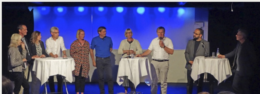
Figur 3. Debatt om renoveringsbehovet i Almedalen 2015.

Förutom den kunskapsuppbyggnad som pågår med hjälp av annan finansiering, har detta SBUF-projekt möjliggjort riktade insatser med informationsdagar, presentationer och informa-