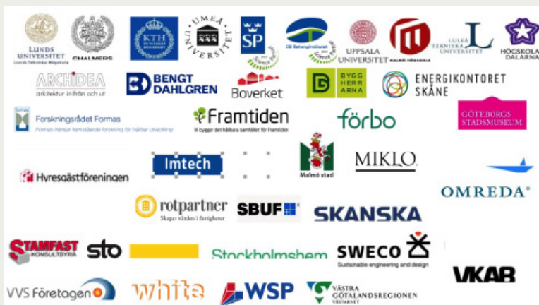
Figur 2. Deltagare i SIREn som är ett projekt och en stark forskningsmiljö kopplad till och sprungen ur Nationellt Renoveringscentrum.

Stor del av den svenska akademien med anknytning till renoveringsfrågor finns med i samarbetet om NRC liksom många från näringslivet. Figur 2 visar nätverket i SIREn, den starka forsknings-